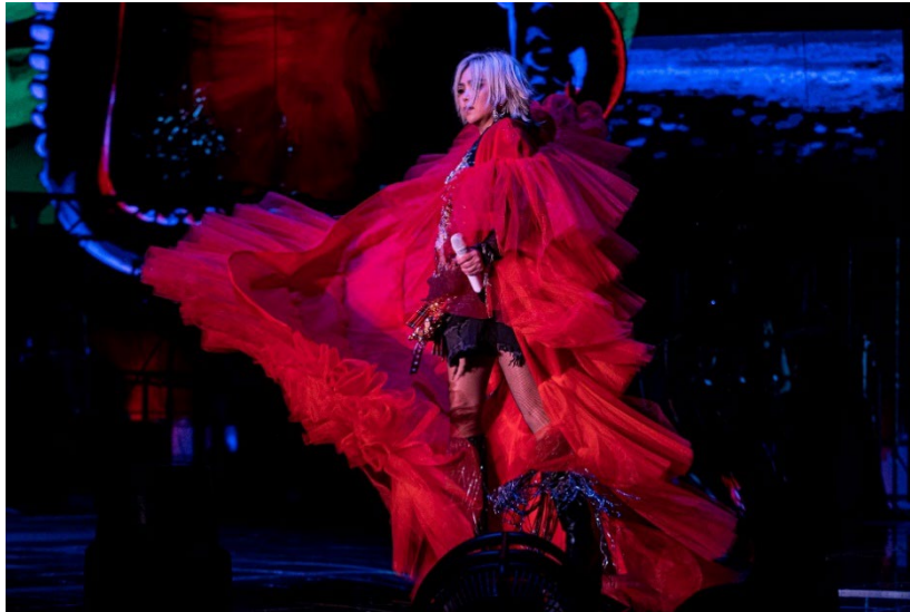
在 2024 年的“ASMR 世界巡回演唱会”上，aMEI 演唱时使用 SKM 6000 手持发射机搭配 MM 445 麦克风头

在此次 ASMR 世界巡演中，极具视觉冲击力的舞美和灯光设计与 aMEI 的演唱融为一体。与此同时，演出的重点回归音乐本身，为观众营造沉浸式音乐体验。